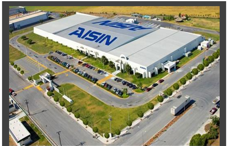
Ilustración 3. Planta de AISIN Manufactura, USA, Seymour, Indiana