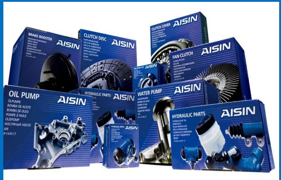
Ilustración 5. Productos AISIN SEIKI.

La empresa está muy comprometida en desarrollar sistemas de gestión de riesgos a nivel global, con el fin de hacer de la organización una entidad capaz de responder ante situaciones inesperadas de forma rápida y aprovechar ese tipo de situaciones de riesgo para encontrar mejoras tanto a sus procesos como productos que desencadenen en más innovaciones (Roth & DiBella (2015).