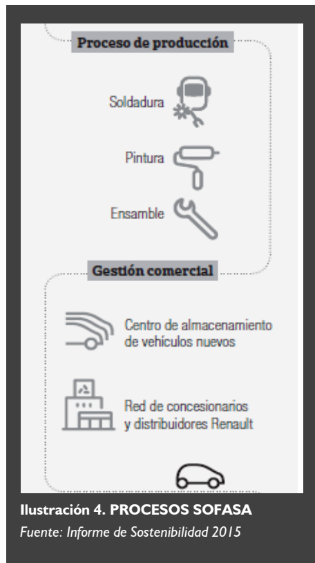
Ilustración 4. PROCESOS SOFASA

En dos ocasiones iniciativas colombianas han recibido el primer lugar a nivel internacional: El más reciente, en 2016 año en que SOFASA fue premiado por la propuesta "Renault Academy Awards", orientada a fortalecer la calidad del servicio de la red de concesionarios. En el año 2012 obtuvo el premio por la propuesta "Kaizen Concesionarios".