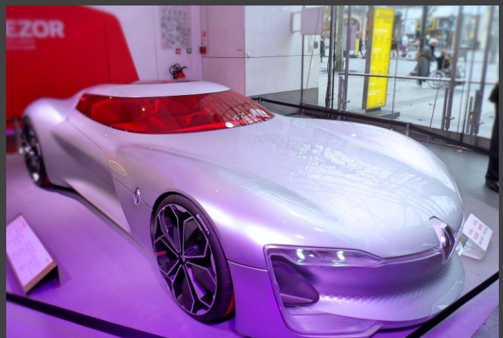
Ilustración 3. RENAULT TREZOR CONCEPT. Coupé eléctrico de 2 plazas con el que la marca busca explorar diseño y tecnología de futuros modelos.